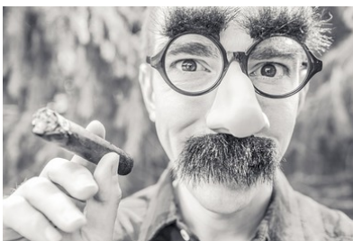
Mann mit Schnurrbart und Brille