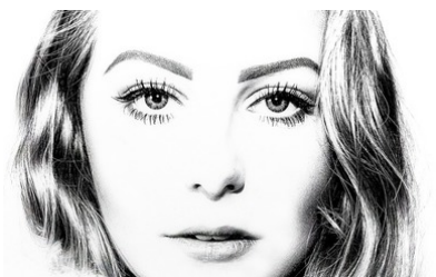
hübsches Mädchen, große Augen