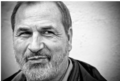
Mann mit Bart und kleinen Augen