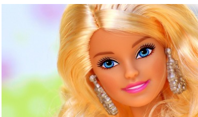
hübsches blondes Mädchen