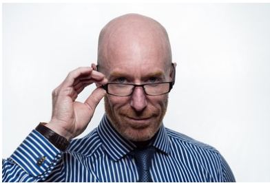
Mann mit Glatze und Brille